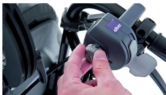
Marche/Arrêt et réglage de la vitesse