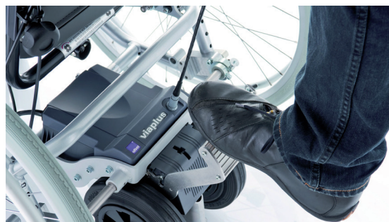
Mise en roue libre

Toutes les fonctionnalités sont clairement indiquées sur la commande maniable et antidérapante qui peut être actionnée d'une seule main pour une utilisation simple et sans effort. La batterie rechargeable du viaplus est montée discrètement sous le siège du fauteuil et est assez puissante pour réaliser de longues promenades. Les batteries peuvent être rechargées rapidement et facilement en utilisant le chargeur de batterie qui s'adapte automatiquement à la tension secteur.